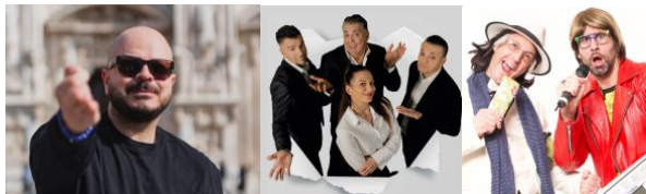
Mandrake – I Malfattori – The Lesionati

Nel Palasummer ognuno trova il suo spazio, dai visitatori curiosi di assaggiare le prelibatezze pugliesi del Pala Street agli sportivi che hanno la possibilità di sperimentare nuovi sport innovativi gratuitamente.