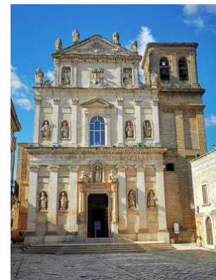
Chiesa Madre di Mesaane

Dal tramonto fino alla sera, i colori della Puglia accolgono tutti in un'oasi di leggerezza, pace e serenità, sensazioni che in ogni borgo è possibile vivere in armonia con l'ambiente circostante. A pochi chilometri da Lecce si trova la splendida cittadina di Mesagne, un luogo antico e affascinante ricco di storia e di paesaggi. "Capitale Cultura di Puglia" 2023, Mesagne è caratterizzata da una costellazione di architetture religiose fra le quali spicca la Chiesa Madre, al cui interno è possibile osservare il barocco in tutto il suo splendore, una delle più grandi ricchezze del patrimonio monumentale salentino.